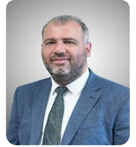
Murat CANGÜL Hazine ve Maliye Bakanlığı Temsilcisi